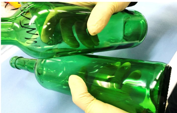
Kratzfestbeschichtung Scratch resistance coating