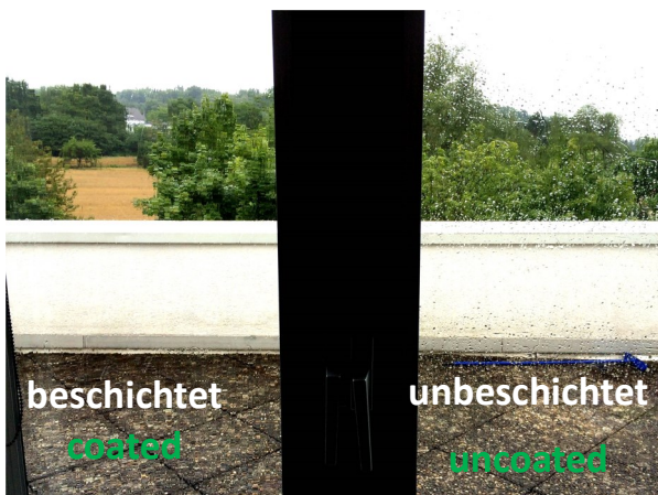
Photokatalytische Selbstreinigung Photocatalytic self cleaning